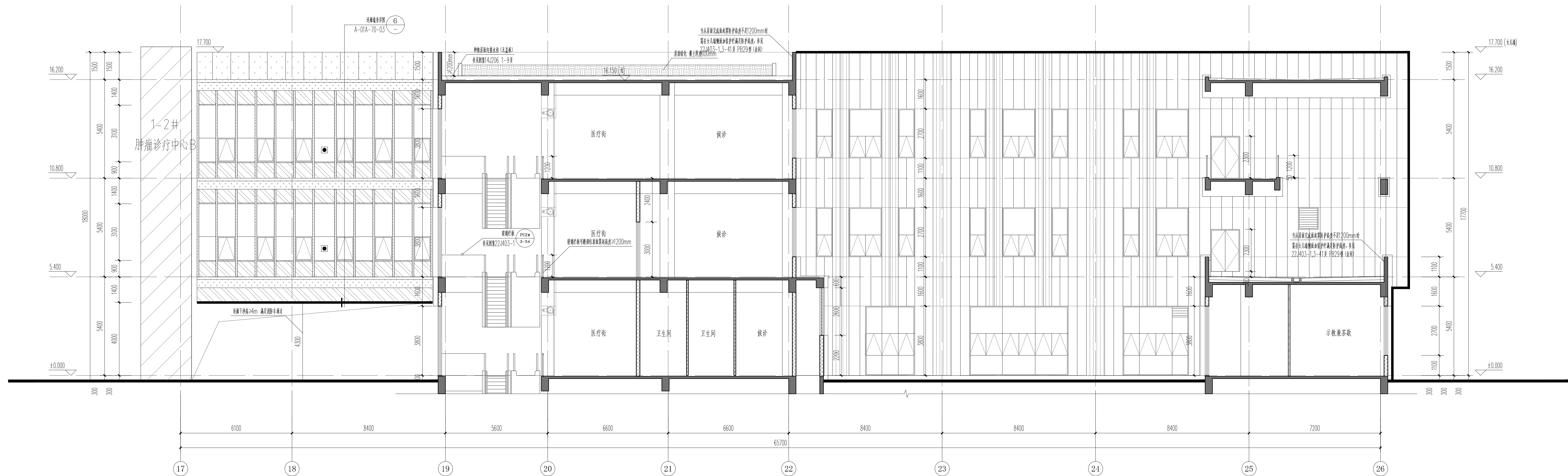
肿瘤诊疗中心A 内庭院1 17-26轴立面图